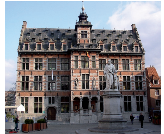
Historisch Stadhuis (1616) op de Grote Markt

VVV-kantoor, Grote Markt 1 Open: oktober-april: elke werkdag 9-12 en 13-16u mei-september: elke dag 9-12 en 13-16u. Contact: (+32) (0)2 356 42 59 toerisme@halle.be