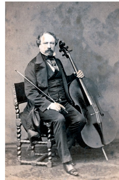
Servais, ca. 1862 Zuidwestbrabants Museum Halle

De jonge Servais ontpopte zich tot een bijzonder getalenteerd cellist. Een virtuoos wou gezien en gehoord worden. Net als honderden andere musici koos Servais daarom voor een reizend bestaan. Zijn reis naar Parijs in 1833-1834 betekende de start van een internationale carrière. In 1835 kwam Londen aan de beurt. Hij trad er op met de beroemde Royal Philharmonic Society en speelde voor het Britse koningspaar. In 1836 bracht Servais een tweede bezoek aan Parijs en het jaar daarop trok hij door Nederland.